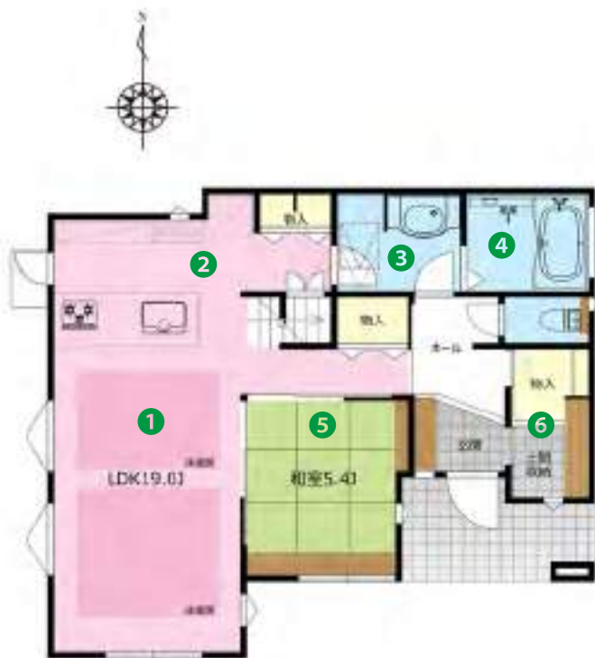
1F / 62.92㎡