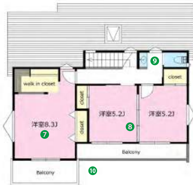
2F / 47.30㎡