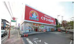
くすりの福太郎 市川大野駅前店