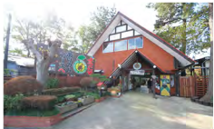
フィールドアスレチックありのみコース