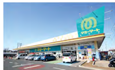
マミーマート 高塚店