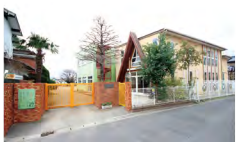
高塚わかば幼稚園